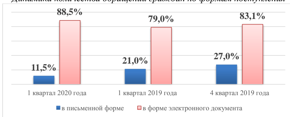
Диаграмма 3 Динамика количества обращений граждан по формам поступления

Как следует из диаграммы 3, в I квартале 2020 года увеличилось количество поступивших обращений в форме электронного документа на 9,5 % в сравнении с I кварталом 2019 года и на 5,4 % по отношению к 4 кварталу 2019 года.